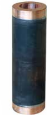
ROTORE MOTORE SOMMERSO 3" - 4" - 6" - 8" senza albero SUBMERSIBLE PUMP ROTOR 3" - 4" - 6" - 8" no shaft