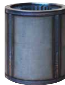
STATORE MOTORE SOMMERSO 6" - 8" saldato TIG e tornito altezze fino a 900mm SUBMERSIBLE PUMP STATOR TIG welded and turned, height up to 900mm