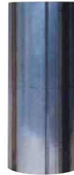
STATORE MOTORE SOMMERSO altezze fino a 900mm con 4 o più saldature TIG SUBMERSIBLE PUMP STATOR height up to 900mm with 4 or more TIG welds