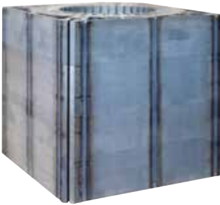
STATORE CON 12 SALDATURE TIG dimensioni fino a 400x500mm STATOR, 12 TIG WELDS dimension up to 400x500mm