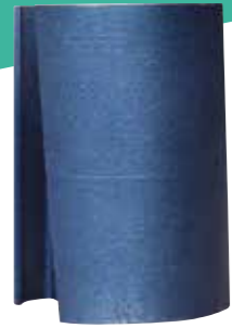
ROTORE ALTERNATORE ALTERNATOR ROTOR