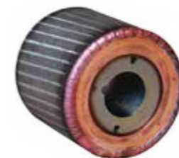
ROTORE CIRCOLATORE CIRCULATOR ROTOR